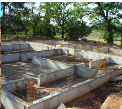
04 Vide sanitaire