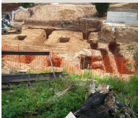
02 Terrassement fouilles