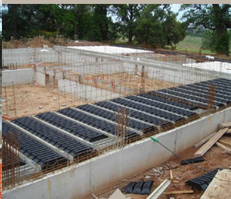
05 Plancher vide sanitaire