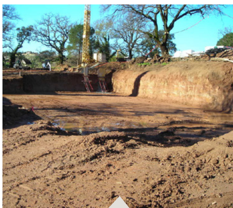
01 Terrassement plate-forme